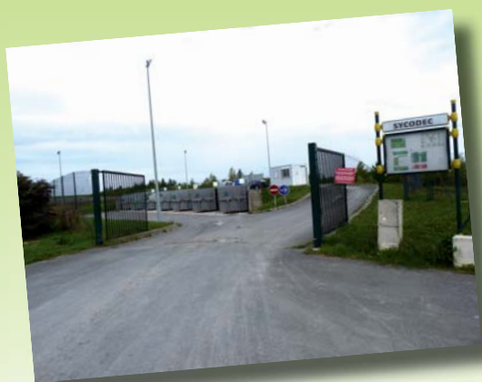
Les déchèteries du Sycodec