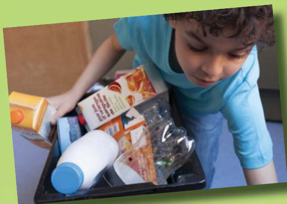
Le tri du bac jaune