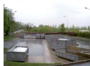
Sillery Convention d'accès jusqu'au 31 décembre 2013

Depuis le 1 er janvier 2013, la commune de Sillery (à laquelle appartient la déchèterie) a rejoint Reims Métropole. Pour assurer la continuité du service, le Sycodec a signé une convention avec Reims Métropole garantissant l'accès des communes à la déchèterie de Sillery jusqu'au 31 décembre 2013.