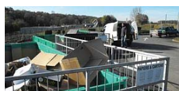
Exemple dans une déchèterie du Nord

Pour limiter les risques de chutes, des barrières seront installées devant chaque benne.